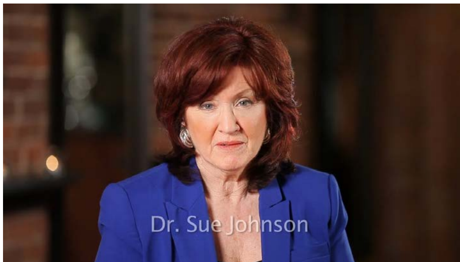
Dr. Sue Johnson